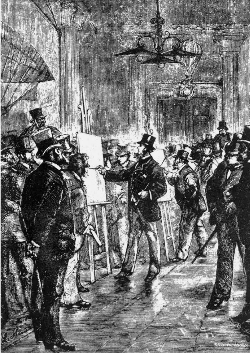
Πρόεδρος του Ινστιτούτου Ουέλντον ήταν ο μπαρμπα-Προύντεντ, ένας τολμηρότατος και πολύ πλούσιος άνθρωπος.