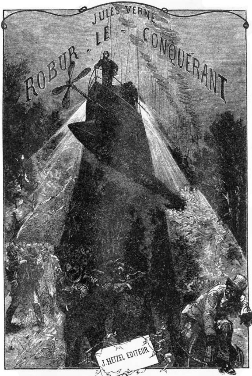
Πρωτοσέλιδο παρμένο από παλαιά γαλλική έκδοσι